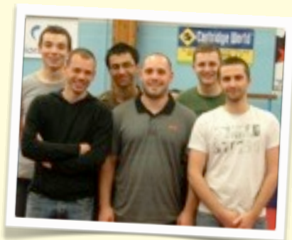
REGIONALE 2 : USM Saran N°1