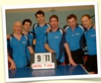
REGIONALE 1 : TT Joué les Tours N°3