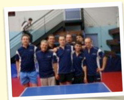
REGIONALE 3 : Cléry St André N°1