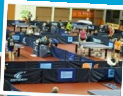
photos de championnats de France 08-09 et 09-10