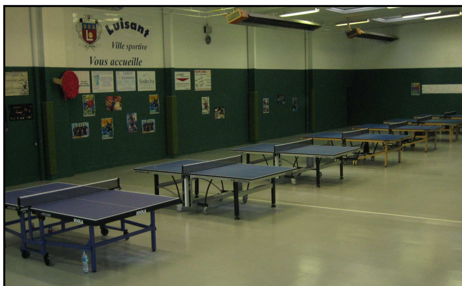
Salle spécifique Tennis de Table de Luisant Complexe sportif Marcel Roblot