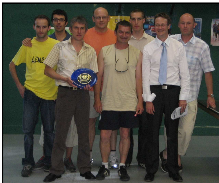
Equipe dirigeante actuellement en place

Le LACTT est donc très fier de l'obtention de ce label qu'il souhaite mettre à l'honneur lors de l'inauguration de sa salle le samedi 28 mai 2011 (15H00).