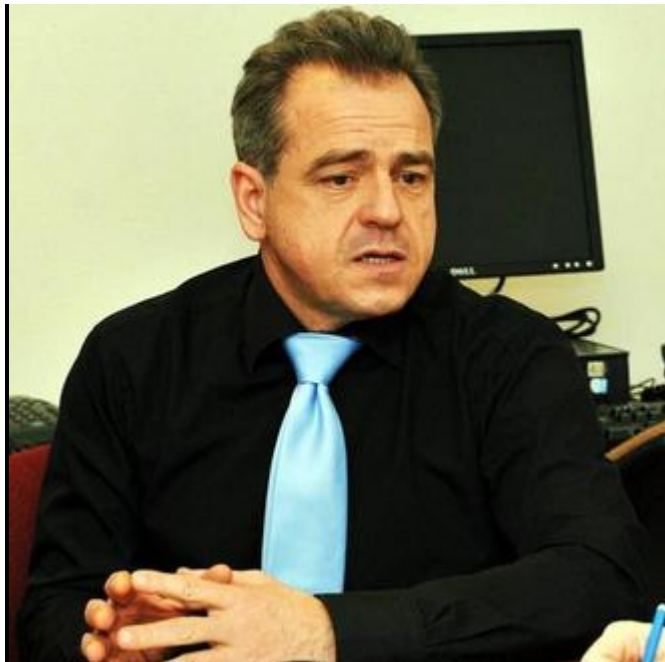
Le manager estime que le TFC a fait le bon choix.